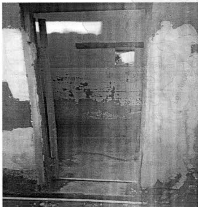
Baño con paredes deterioradas y moho.