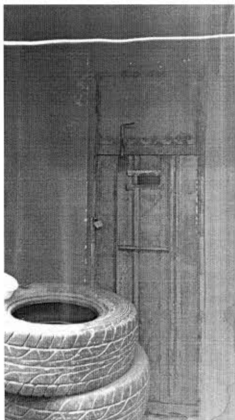
La celda judicial