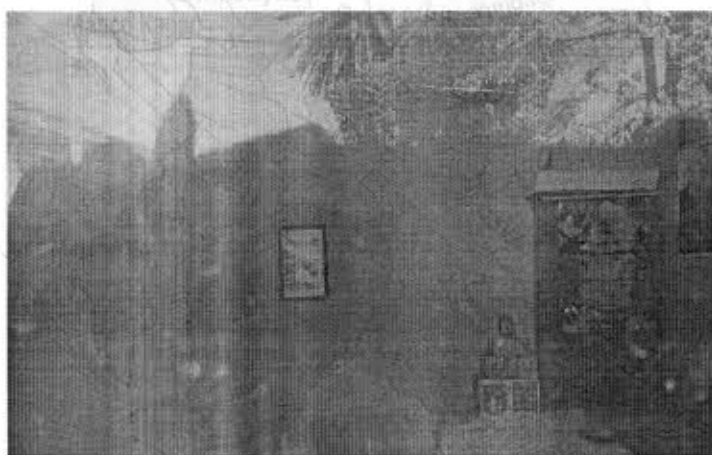
Al interior del ambiente recuperado el 2017 que anteriormente funcionaba como oficina de turismo.

"La Paz Eterna Sede de Gobierno" Declarado por Ley Departamental N° 026