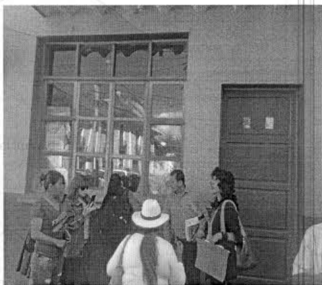
La gobernación explicando la recuperación del ambiente de la Planta Baja.