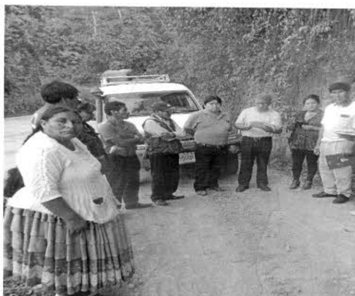
INICIO DE LA INSPECCIÓN OCULAR NO. 01/2018-2019 COMISIÓN CIIPOP