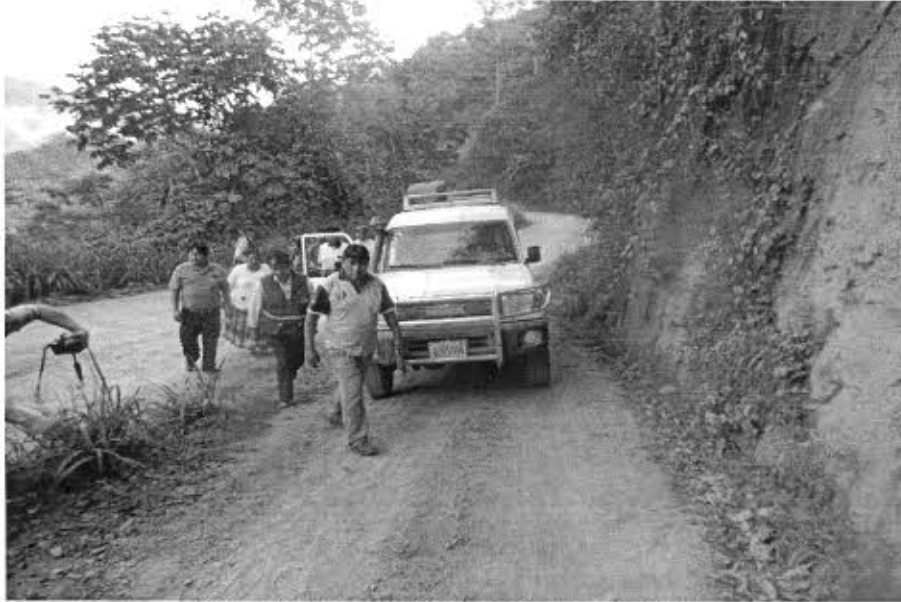
EL TRAMO CAMINERO INTERCEPTA CON RED FUNDAMENTAL "CARANAVI - GUANAY"